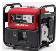
ガソリン式発電機の例

A 地域防災計画では、避難所の運営を行うため、「非常用発電機」を配備することとしており、避難所の照明やデジタル防災無線などの使用を目的に、ガソリンを燃料として発電機を 257 ヶ所全ての避難所に 1～4 台配備しています。