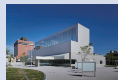
2021年リニューアルオープンした「八戸市美術館」

八戸市美術館では、天井が約17mもある巨大な空間「ジャイアントルーム」が1階にあり、この部屋を市民が自由に出入りできます。また熊本市現代美術館は市街地のビルの中にありますが、美術館を出て商店街のアーケード内での出前展示や、トークショー・上映会などのイベントを実施しており、美術館が身近に感じるイベントを多く実施していると感じました。