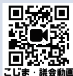
こじま・議会動画

静岡市議会では、本会議の様子を生中継と録画中継でご覧いただけます。 右のQRコードから、私の全質問項目が確認でき、本会議の動画もご覧いただけます。 是非、ご覧ください。