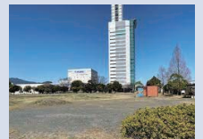
アリーナ建設予定の東静岡駅北口 市有地

東静岡駅北口に建設予定の多目的アリーナは、バスケットボールやバレーボールなどのスポーツ、人気ミュージシャンによるコンサートや音楽フェス、国際会議や展示会など、多目的に活用することができます。ワールドカップバスケで盛り上がった沖縄アリーナでは、バスケ以外にも多目的に活用し、収益性が向上しているようです。また、 アリーナの防災機能 としての役割をしっかりと説明することで、地域住民の方の安全安心にもつながると考えます。