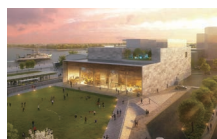
海洋・地球総合ミュージアムイメージ

Q 施設内容の周知と開館までの盛り上げのために、どのような活動を計画していますか。