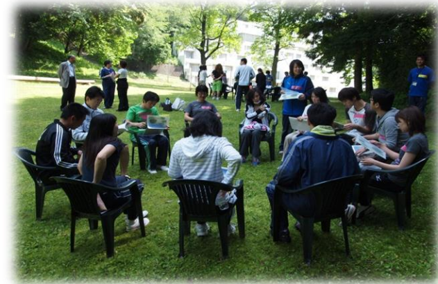
チームビルディングとは・・・ 説明を受ける委員会メンバー